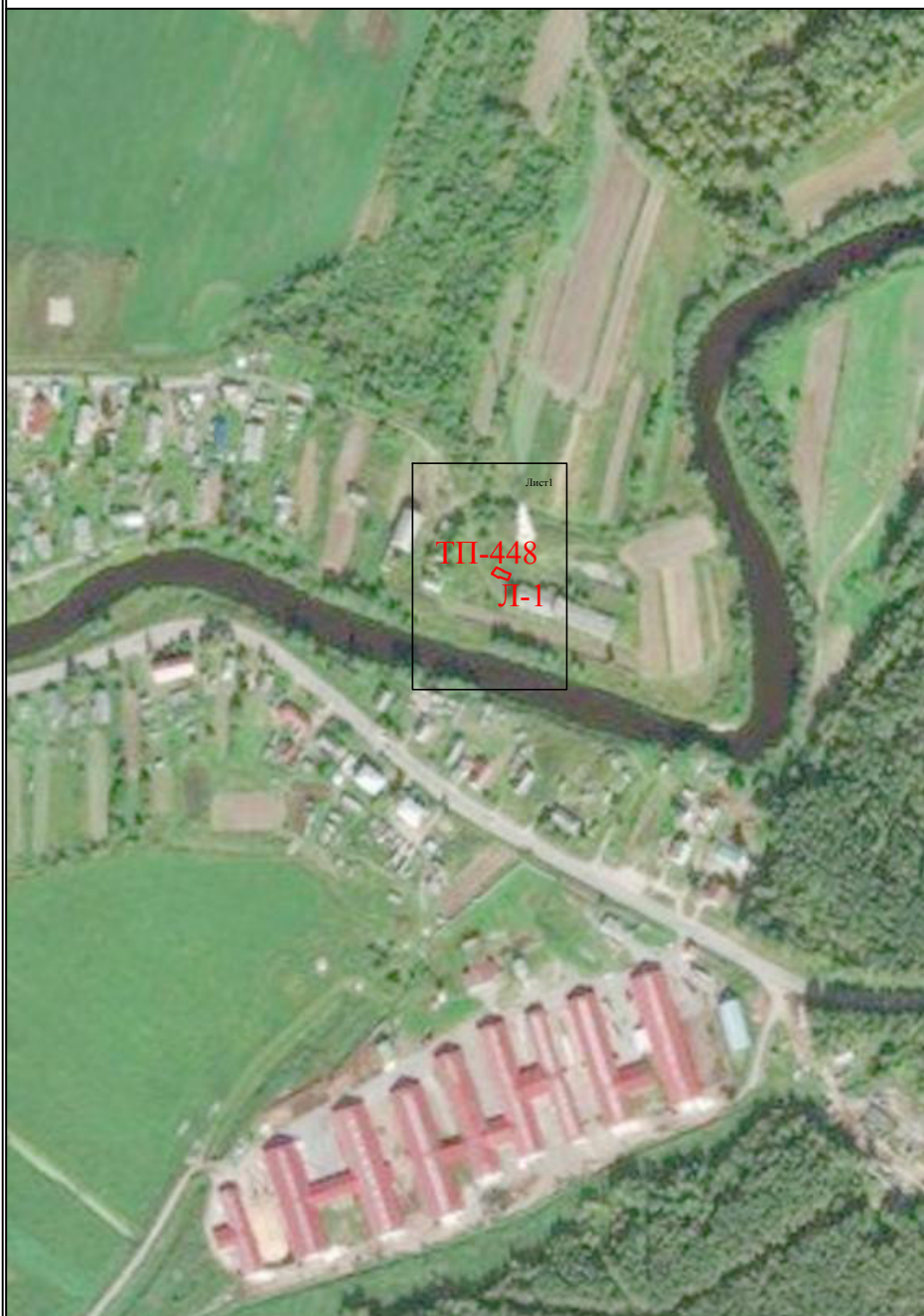
Схема расположения публичного сервитута для размещения (эксплуатации) объекта электросетевого хозяйства ВЛ-0,4 кВ от КТП № 448